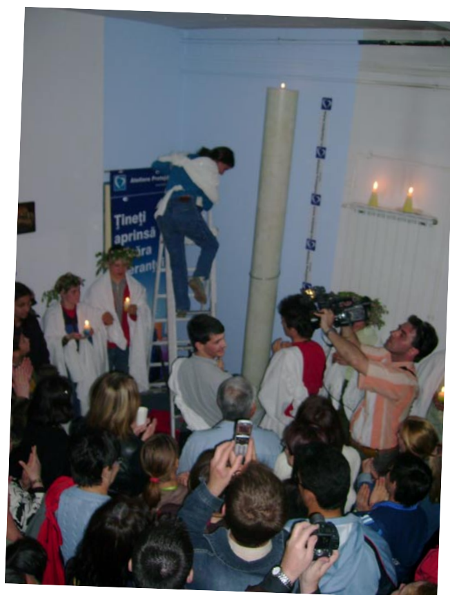
Lumanare record de 2,95m inaltime si aprinderea lumanarii la „Noaptea Lumanarilor“ 2007.