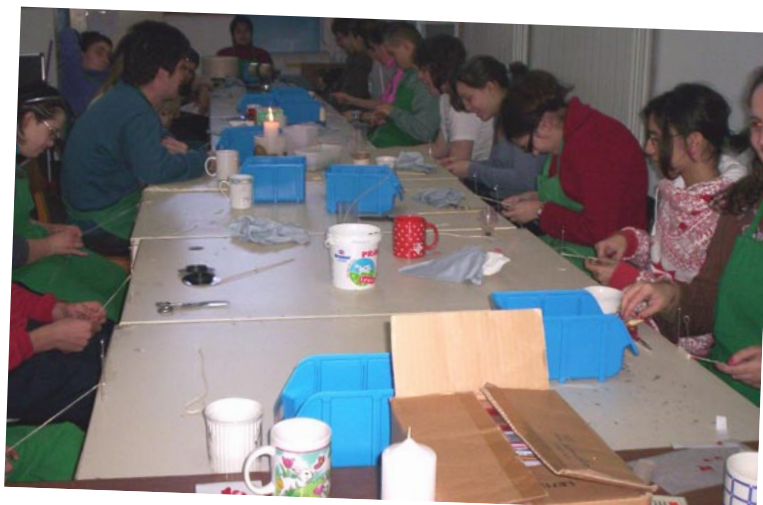
Un atelier mai plin la vizita unei grup de elev de la scoala Goethe din Bucuresti, pe 28.01.2008

A doua intrebare care se pune este bineinteles daca are sens sa faci parteneriate cu institutiile statului? Am fost intrebati deseori daca nu dorim sa luam masuri juridice. Un raspuns nu este usor pentru noi. Pe de o parte este vorba despre un contract care face posibila luarea unor astfel de masuri. Pe de alta parte este vorba despre situatia de fapt, ca nu a existat nici un interes legat de munca din atelier. Deci intrebarea se poate reformula: „Are un sens sa lucram cu oameni dezinteresati?“ Aici raspunsul nostru este clar: „Nu“. Asta inseamna pentru noi ca pe viitor, parteneriatele cu institutiile statului le vom analiza foarte atent. Ne vom concentra energia in special spre ceea ce putem face noi. Aceasta inseamna pentru oamenii care vin la atelier, mai multa siguranta si este o garantie pentru increderea multor sponsori si donatori, care ne sustin continuu.