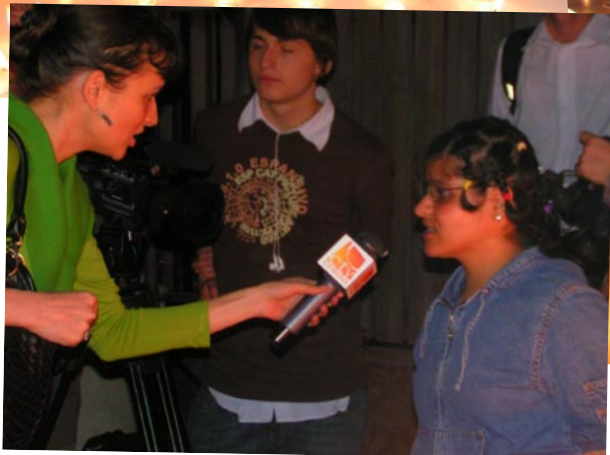
Prezenta presei i-a facut pe tinerii nostri sa se simta adevarate vedete, dand interviuri si povestind despre activitatile lor.